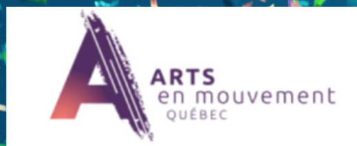
Arts en mouvement Québec